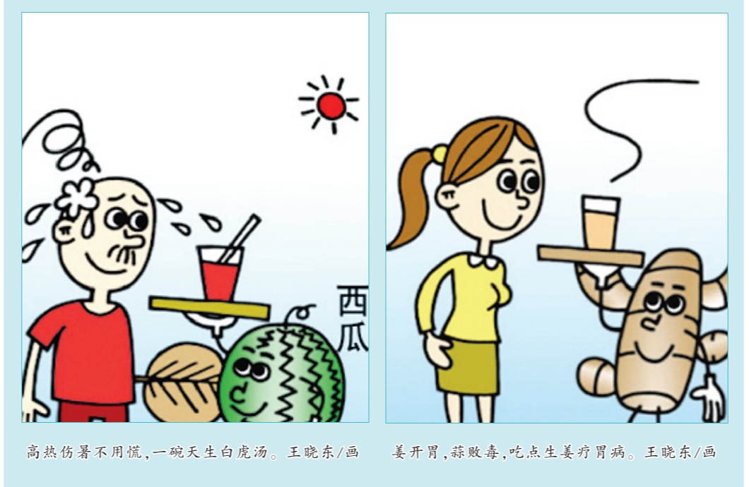
高热暑不用慌,一碗天生白虎汤。王晓东/画 姜开胃,蒜败毒,吃点点姜开胃。王晓东/画